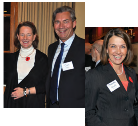
Gary Doer , ancien premier ministre du Manitoba et actuellement ambassadeur du Canada auprès des États-Unis, a pris la parole lors d'un souper spécial sur les politiques qui a eu lieu à Calgary, en octobre 2011. Parmi les leaders en politique présent, on peut citer Alison Redford (avec l'ambassadeur Doer), première ministre de l'Alberta, et Danielle Smith , chef du Wildrose Alliance Party of Alberta. Cet événement a été commandité par GE.