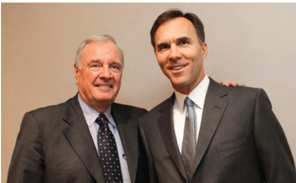
Le très honorable Paul Martin avec Bill Morneau , président du conseil de l'Institut. L'ancien premier ministre Martin a parlé de « Les Canadiens autochtones – L'éducation du segment de notre population qui est le plus jeune et qui augmente le plus rapidement »

Pendant l'année 2012, les pressions fiscales pèseront de plus en plus lourd sur les gouvernements canadiens et leurs contribuables. Des analyses perspicaces et des politiques prudentes seront requises.