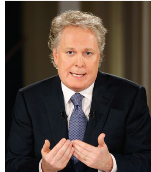
L'honorable Jean Charest , premier ministre, a pris la parole, lors d'une table ronde de l'Institut qui a eu lieu à Montréal, sur « Le Québec : au bon endroit, au bon moment ».