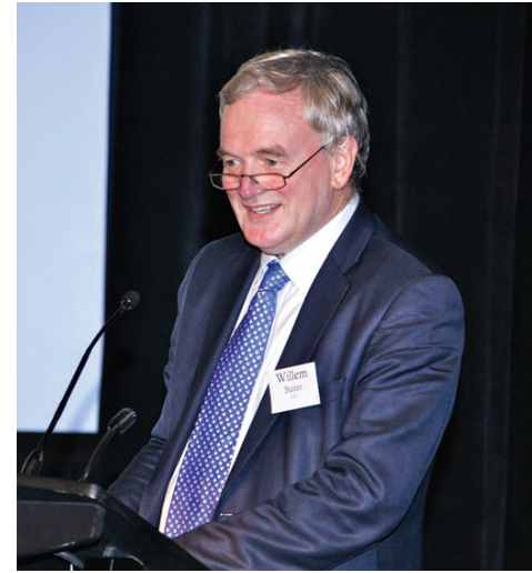
Willem Buiter , économiste en chef, Citi, chargé de recherche internationale, Institut C.D. Howe