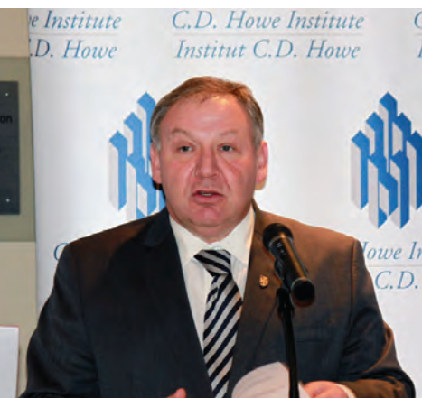
L'honorable Darrell Dexter, premier ministre de la Nouvelle-Écosse, a parlé à l'institut de « L'avenir énergétique du Canada atlantique ».

La dernière année a marqué un tournant dans le débat du Canada sur la croissance économique, la productivité et l'innovation, alors que les gouvernements ont commencé à démontrer qu'ils avaient la fermeté nécessaire pour donner un coup de pouce à la croissance économique anémique et à l'investissement au Canada.